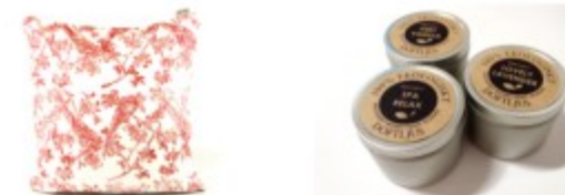
Hemtextil, ekologiska ljus och ekologiska doftljus

Casalo är en leverantör av unika inredningsdetaljer. Vi arbetar efter våra ledord: Medvetenhet, Ursprung, Design och Möten. Vi väljer noggrant våra leverantörer och