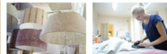
Handgjorda lampskärmar i linne med handtryck