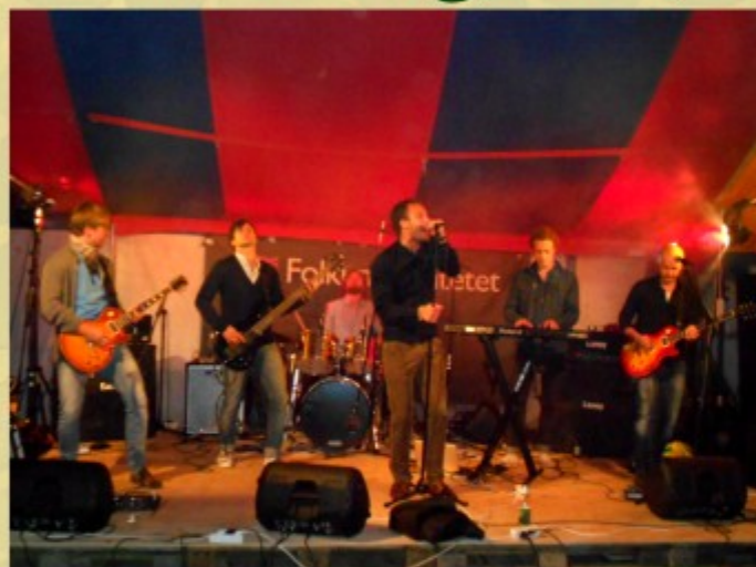
Sons of South, Mossagårdsfestivalen 2011

Vi ses på Mossagården! Charlott Johansson ~ Folkuniversitetet